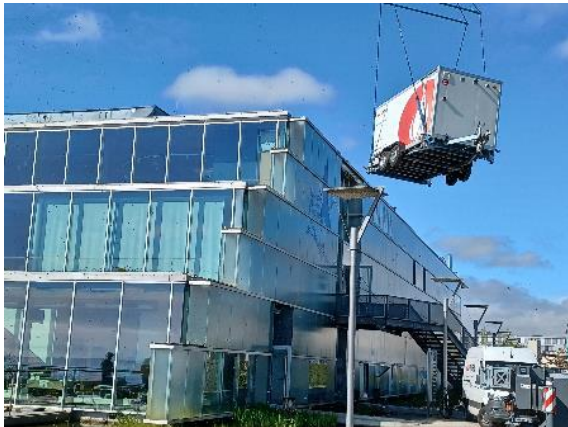
BU: Kran hebt mobile Heizzentrale am SEA LIFE Konstanz in die Luft