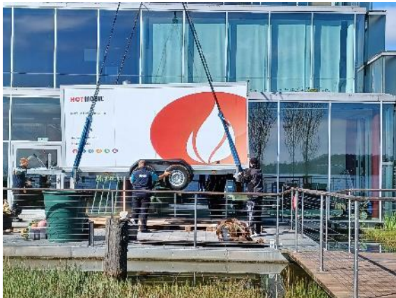
BU: Mobile Heizzentrale wird mittels Krans auf der Terrasse platziert