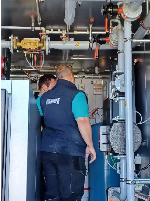
BU: Einweisung eines Mitarbeiters des SEA LIFE in die Bedienung der mobilen Heizzentrale